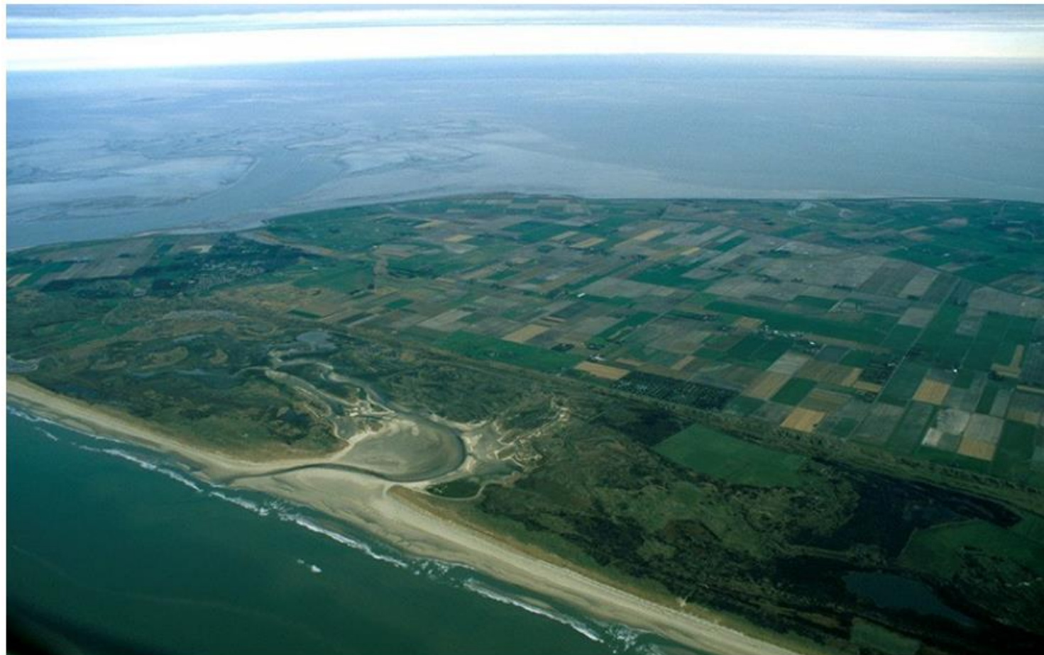
Figur 12.1: Billede af The Slufter, Texel